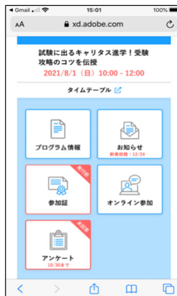
プログラム詳細画面