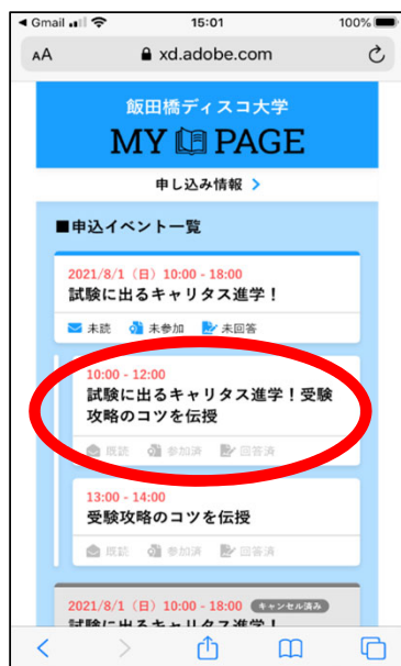
申込イベント一覧画面